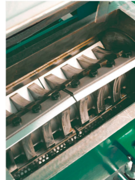
Cámara de trituración