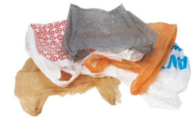
Bolsa de plástico